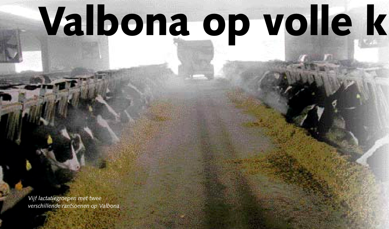
Vijf lactatiegroepen met twee verschillende rantsoenen op Valbona

programma ook de melkkwaliteit en het productieniveau onder de loep. Zappa zweert bij de externe gegevensverwerking. 'Daardoor vermijden we bedrijfsblindheid en blijven we alert op de resultaten van het bedrijf. Advies van buiten levert een beter inzicht in je eigen bedrijf.'