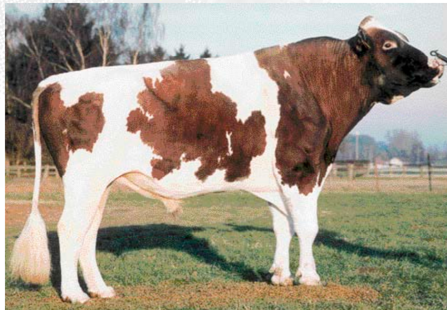
Jubilantzoon Jubel: extreme vererfer van laag ureumgetal