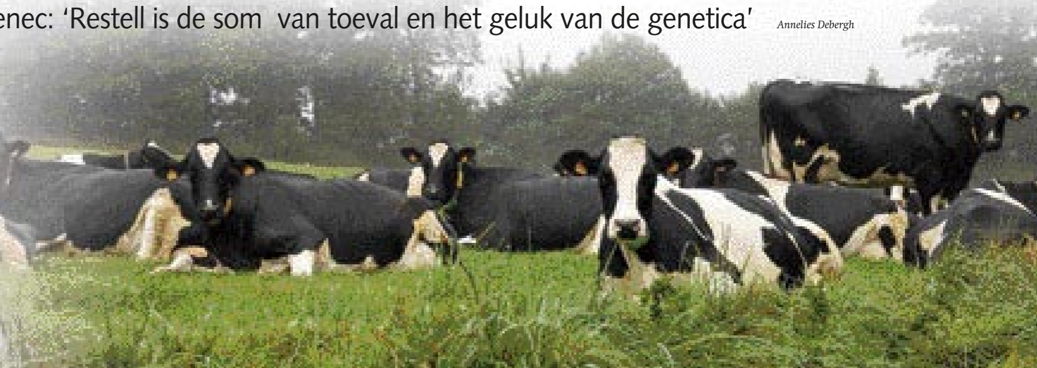
Op zoek naar ideale balans tussen productie en exterieur

Stiercontracten behalen vormt een van de prioriteiten op het Franse bedrijf. Vijf koefamilies komen op dit moment in aanmerking. 'Vanuit die gedachte moeten we goed letten op de ISU-fokwaarde van onze veestapel', vervolgt Stéphane, terwijl het