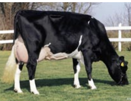
Pietje 513 (v. Celsius), 86 punten Prod.: 7.09 305 14.781 5,17 3,74 LW 129