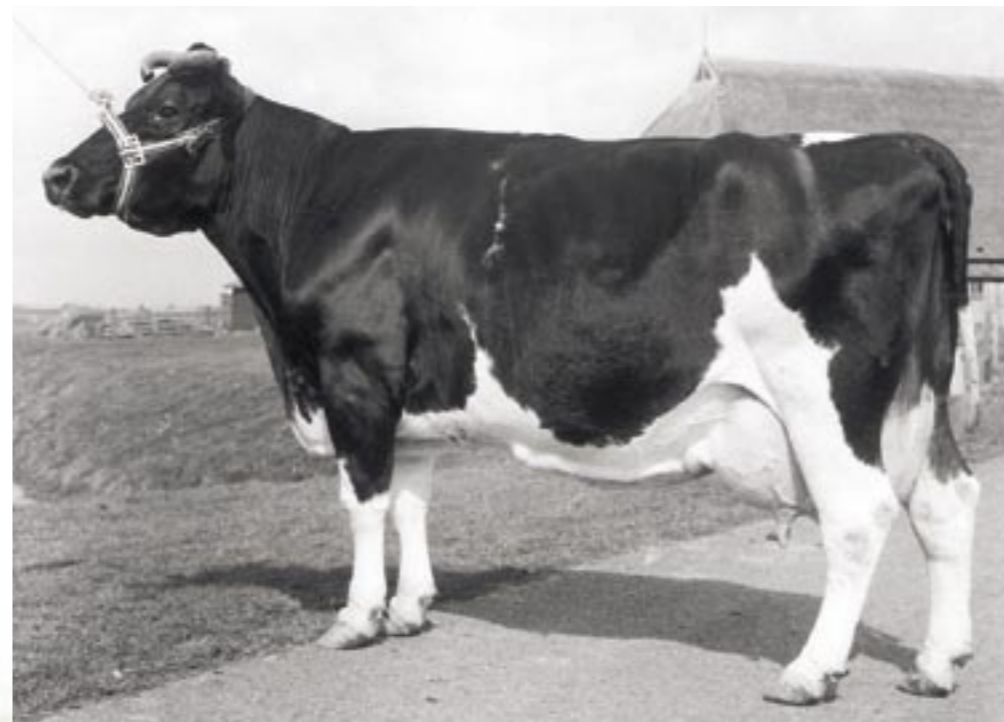
Pietje 80 (v. Haubois Anna's Adema), 90 punten Productie: 11.7 305 11.073 4,36 3,33