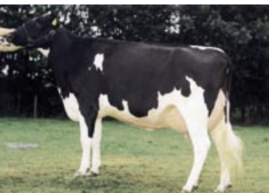
Pietje 298 (v. Jabot), 90 punten Prod.: 4.08 305 11.082 4,41 3,80 LW 119