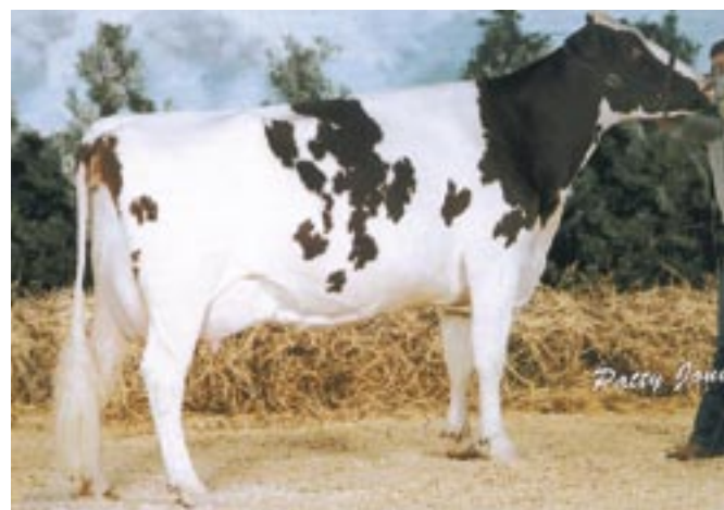
Blackrose (v. Blackstar), 96 punten Productie: 5.03 305 16.520 4,6 3,3