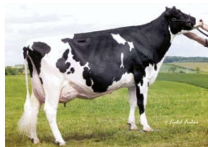
Lavender Ruby Redrose (v. Rubens), 95 punten Productie: 4.00 305 17.350 3,5 3,5