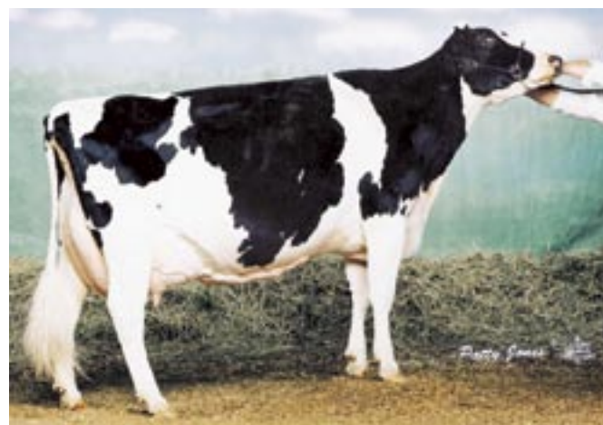
Blackrose 3-ETN (v. Blackstar), 92 punten Productie: 3.06 365 12.761 4,4 3,3