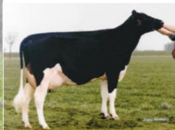
Volmers Ronny (v. Ronald), 87 punten Prod.: 2.05 305 10.918 4,11 3,73 LW 117