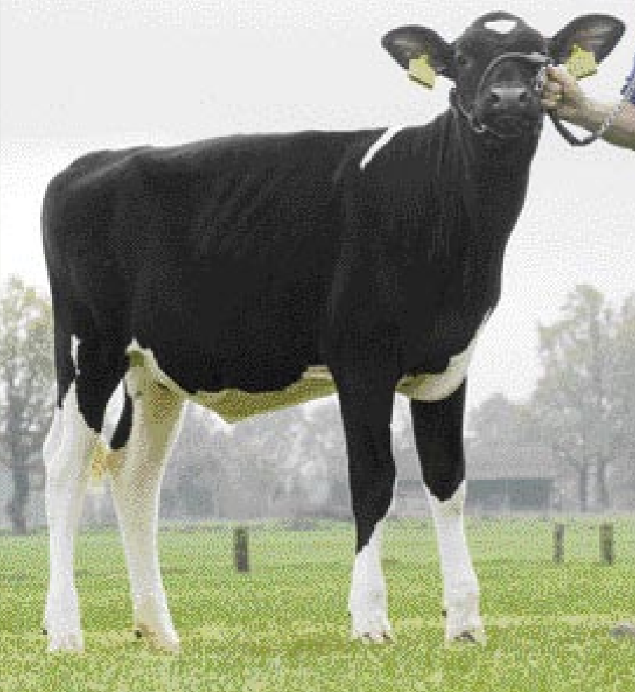
De fraaitypische De Volmer Ronny 31 is de hoofdprijs van de Veeteelt-kerstquiz 2005