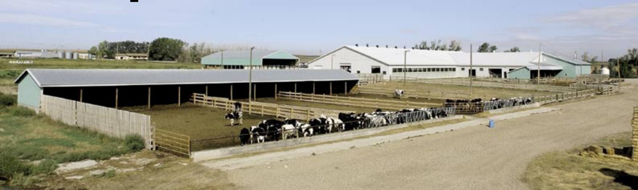
Geen weide voor de 160 melkkoeien