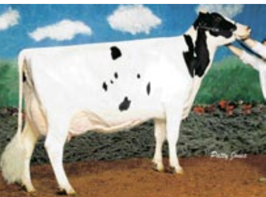
Etazon Anncy (v. Captain) Prod.: 2.02 305 12.264 3,62 3,48 LW 115