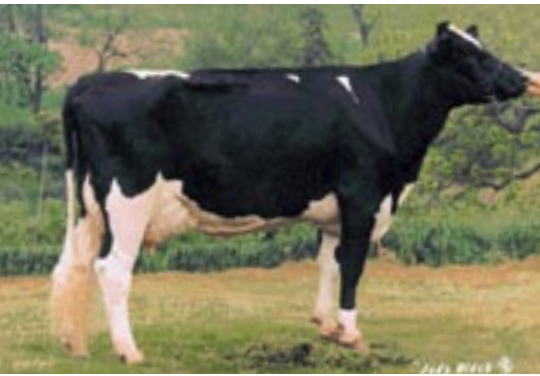
Plushanski Cleitus Farci (v. Cleitus), 87 pnt. Productie: 2.01 305 12.633 4,5 3,6