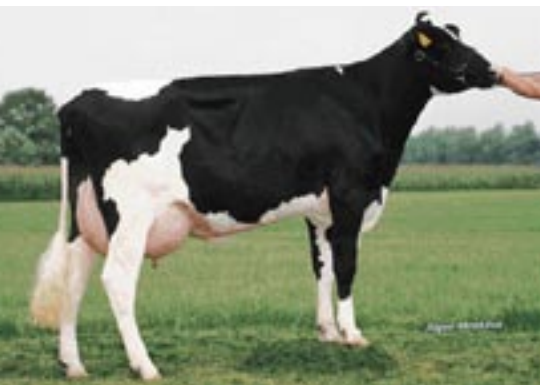
Delta Pearl (v. Jabot), 87 pnt. Prod.: 2.00 305 9475 4,60 3,82 LW 115