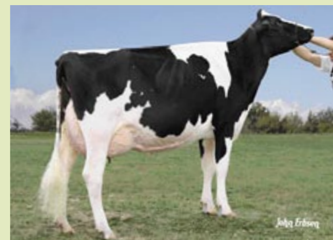
Succesvolle kloon van Paradise in Madison: Paradise 2