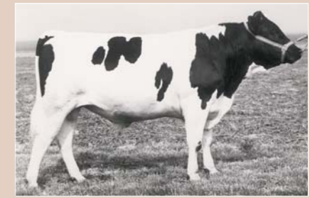
Primo van de Zandvenne, zoon van Pilot Star Primo en Jeltje YB 455

Ook daar kreeg ze weer respect door haar werk en optreden terwijl ze haar nog jonge kinderen een eigen verantwoordelijkheid bijbracht, mogelijk omdat ze wist dat ze niet oud zou worden. Op 28 juni 1978 overleed Trijntje Blanksma-Van der Zwaag, nog maar 54 jaar oud. 'Rijk gezegend, zwaar beproefd en warm bewogen', schreef men bij haar overlijden. In Pingjum werd ze bij haar man begraven. Samen met de koeien kocht Wagemaker ook het restantje sperma van Zimmerman Pilot Star Primo, waarmee hij de in 1964 aangekochte Vine Jeltje YB 433 insemineerde. Op 13 februari 1970 werd uit deze verbintenis het stierkalf Primo van de Zandvenne geboren, de eerste 'halve