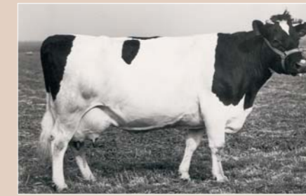
Moeder Vine Jeltje YB 455 Productie: 7.0 6053 5,07 3,28