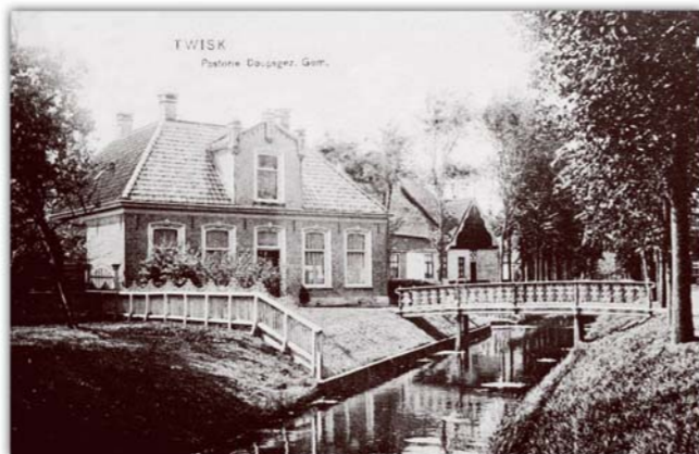
De doopsgezinde pastorie van Twisk

zeer ongebruikelijke voorwaarde aan toe: ‘Dat u zich zult onthouden van acties tegen de huidige fokrichting en stamboekvoering van het zwartbonte vee in Nederland.’ De connectie tussen de stamboeken en het productschap bleek groot, al kon die niet voorkomen dat de verordening in 1958 werd afgeschaft. Blanksma was tot 1959 vrijgezel, hij was al 47 jaar. Toen ontmoette hij in het kader van de doopsgezinde broederschap de elf jaar jongere Texelse predikante Trijntje van der Zwaag en ze waren op slag verliefd. Nog hetzelfde jaar trouwden ze en in rap tempo werden op de Pingjumer boerderij vier kinderen geboren, waarvan de oudste helaas zwaar gehandicapt was. Voor diens verzorging kwam er een meisje uit Texel: Jane Verijken, die nu in Twisk woont. Zij kan zich de sfeer in het gezin nog goed voor de geest halen. Aan tafel hoorde ze de sombere verhalen over zieke koeien en de vele kalveren die voortijdig en dood werden geboren. En al besefte ze het toen niet helemaal, het kwam financieel goed uit dat ds. Trijntje Blanksma soms een invaldiens in de kerk of een trouwerij kon doen, wanneer haar zwangerschap dat toeliet.