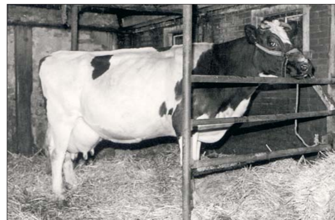
Vinea Maaike 194 (v. Vinea Siguerd 23 Melkbron) als bijna vijftienjarige in Twisk, productie: 6.9 6992 4,18 351 3,42