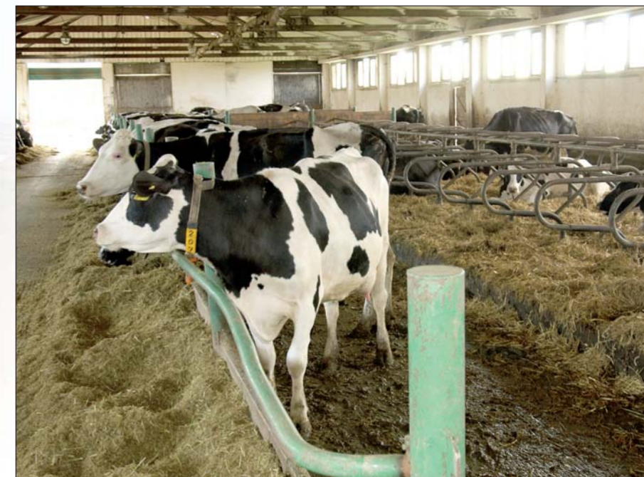
Het melkvee is gehuisvest in een omgebouwde vleesstierenstal

Het antwoord op de vraag welke stieren worden ingezet, moet Bruinsma schuldig blijven. 'Amerikaans bloed gebruiken ze het liefst, en daarnaast stieren van de lokale KI. Mijn Nederlandse collega Siebenga is ook zo'n fokkerijman, ik heb daar minder gevoel voor. Ik heb erg mijn best moeten doen om door te voeren dat een koe na twee inseminaties in een groep