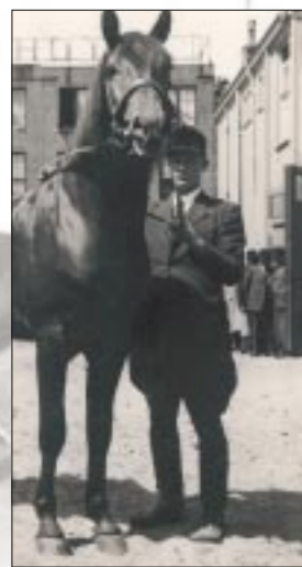
De hengst Karush in 1939 op de tentoonstelling in Scheveningen