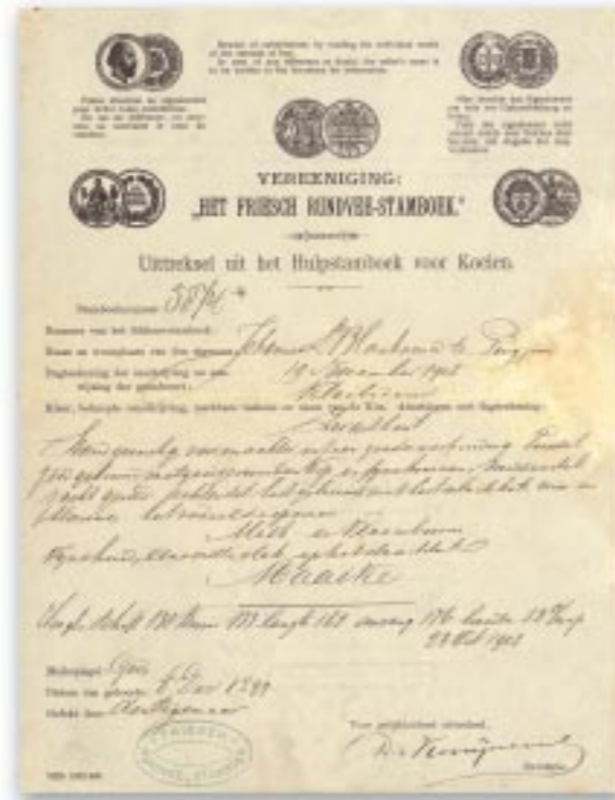
Het stamboekbewijs van de eerste Maaike, geboren in 1899