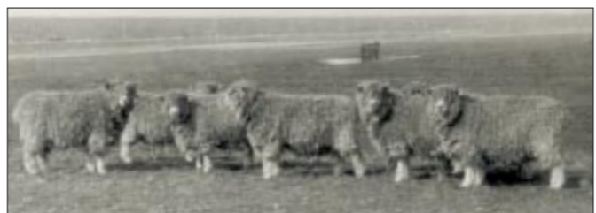
Lincolnschapen in 1946 achter de intussen aangelegde Afsluitdijk

tweede prijs op de keuring in Leeuwarden, enkele maanden later stond hij in de Friese keurcollectie op de tentoonstelling Het Volle Profijt in Enschede en in oktober van hetzelfde jaar werd hij in Leeuwarden kampioen. Deijne Optimist had geen enkele binding met de populaire Ademalijn. Via onopvallende stieren als Bouke, Durkjes Pel Dirkje, Pel Dirkje en Jonge Pel Rooske voerde hij het (bijna in het vergeetboek geraakte) bloed van de preferente Pel Rooske, die in zijn dagen (de jaren twintig) al de aandacht had getrokken van de Noord-Hollandse fokkers op zoek naar de melkrijke trekken in de Friese bloedlijnen.