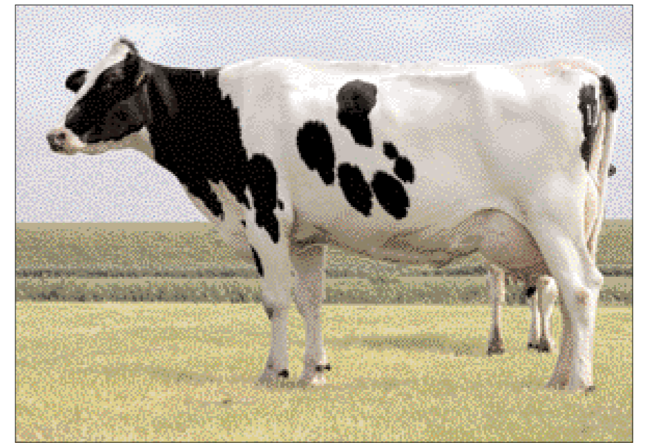
Zwartje 1106 (v. Rudolph), productie: 3.05 305 10.505 4,19 3,63