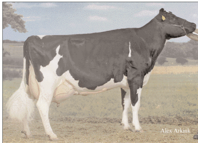
Kathleen 392 (v. Lord Lily), reservekampioene oudere koeien Productie: 5.06 352 13.158 4,57 3,23 LW 112

haar mooi hellende kruis en haar prachtig beaderde, hoog aangehechte uier.