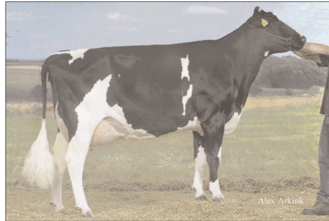
Lola 35 (v. Storm), reservekampioene jonge koeien Productie: 2.03 299 7721 4,53 3,42 LW 106 I.I.