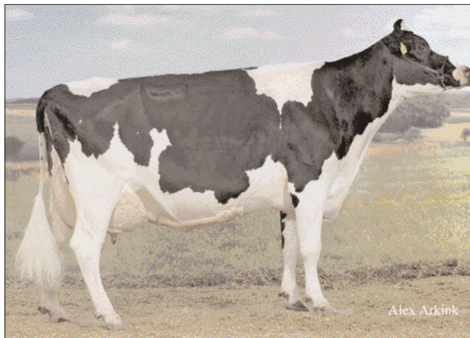
Margriet 226 (v. Malabar), kampioene oudere koeien (en publieksfavoriet) Productie: 4.06 444 13.139 4,48 3,67 LW 106