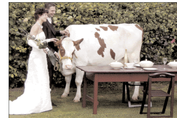
Bruidegom en bruid geflankeerd door Stadeldochter Johanna 132

Op 20 mei trad onze buurjongen in het huwelijk. Hij en zijn bruid wilden beslissend met een koe van ons op de foto. Nadat ze zelf een melkkoe hadden uitgezocht, kwamen ze terecht bij een van onze beste dieren, Johanna 132. Je raadt het al, een Stadeldochter. We melken er negen met volle tevredenheid. De foto bewijst nog eens dat ze ook een super karakter heeft. Deze 86-punten Stadeldochter stond gewoon tien minuten stil voor de fotograaf om fantastische plaatjes te schieten.