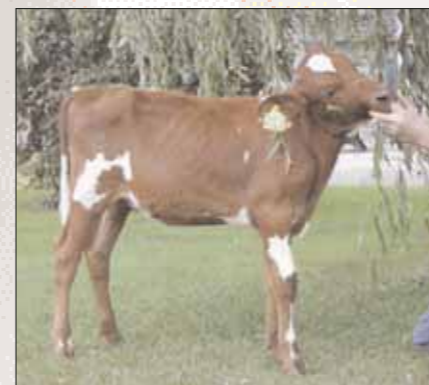
Mieke 102, Stadelpink met een bijzondere donkere kleur