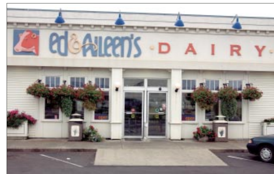
Edaleen Dairy, voorheen Ed & Aileen's Dairy, één van de weinige zelfzuivelbedrijven in de VS