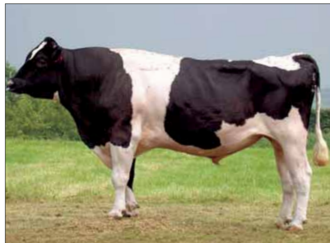
V Eaton hoog en stabiel in de Deense toprijst

De fokwaarde van TVM Hesne is inmiddels gebaseerd op ruim 16.000 dochters.