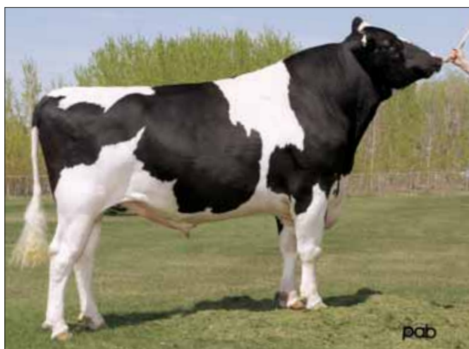
Emersonzoon Phoenix debuteert met sterke gehalten