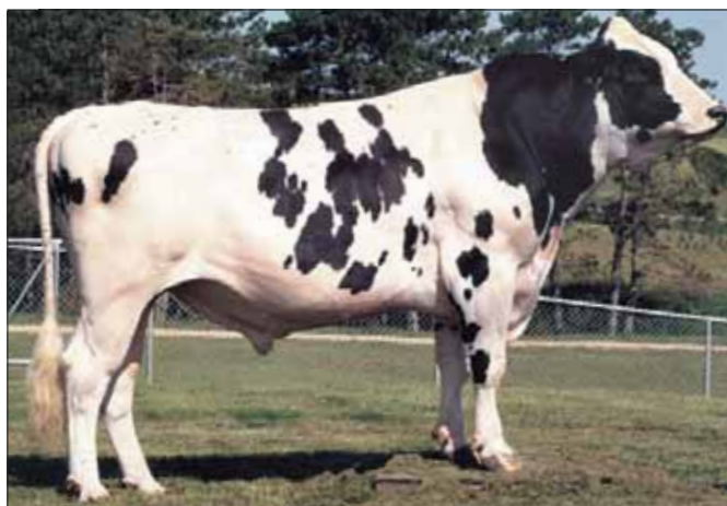
Importnominatie voor Canyon-Breeze Air-Time