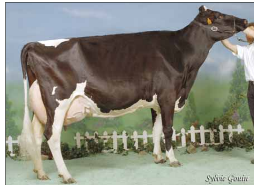
Rebeka (v. Comestar Leader) Productie: 5,00 305 9381 4,06 3,37