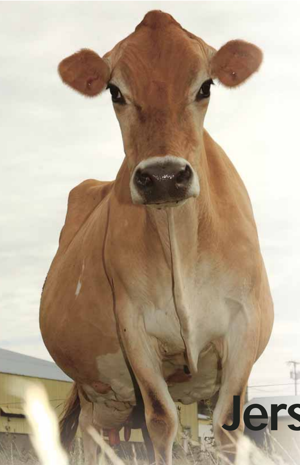
Hairbright, met zestien levensjaren bijna als familie beschouwd