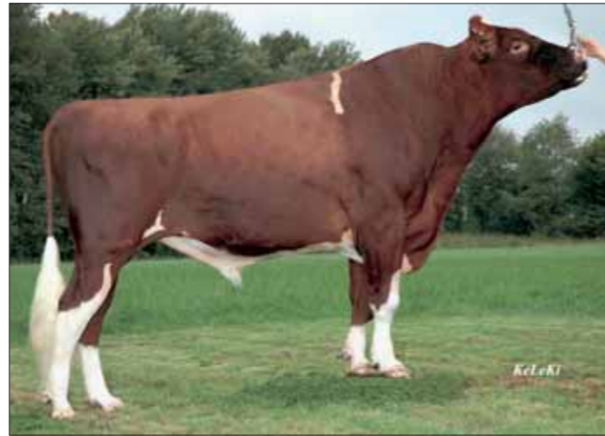
Debutant Ludox pakt eerste plaats in Duitsland

Tulipzoon Taecks gaat al een aantal draaien mee, maar moest deze draai flink verliezen.