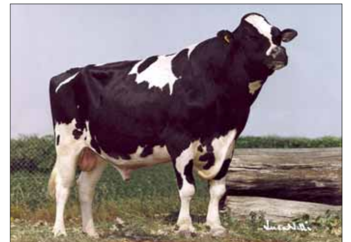
Cijfers Boss Iron stabiel na introductie fokstierdochters

Eveneens afkomstig uit een bekende familie is Carol Winchester Darling. Deze Winchesternazaat komt voort uit de halfzus van Mtoto, een 89-punten Lukemoeder. Een totaal exterieur van 108 punten maakt Darling interessant genoeg voor HG/VRV om de stier