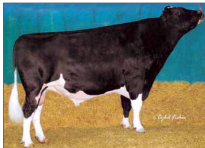
Nieuwkamer Delight uit keuringsvedette Miracle

Delight aan toe wordt gevoegd. Delight is een Decisionzoon uit de Frans gefokte en naar Duitsland verkochte keuringsvedette Miracle (Bellwood x Mascot). Miracle is ingeschreven met 94 punten en afkomstig uit de Rollsfamilie.