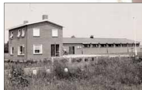
Onder: het station in 1966