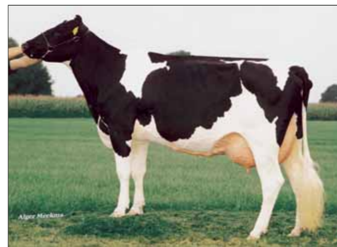
Delta Camilla (v. Fari's Wayne), 87 punten Productie: 2.00 305 10.481 4,94 3,81