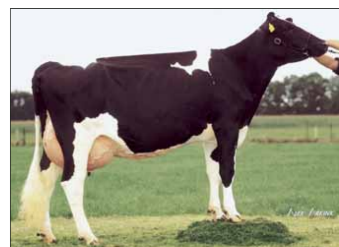
Delta Canberra (v. Celsius), 87 punten Productie: 2.03 305 11.277 3,77 3,48

De nieuwste loot aan de stamboom van Walkup Bell Lou Etta is Delta Canvas. Zowel zijn moeder, zijn grootmoeder als zijn overgrootmoeder promoveerden tot donor na de Delta-test. 'Qua exterieur en melkproductie springen de nazaten uit de Lou Ettafamilie er gewoon uit.'