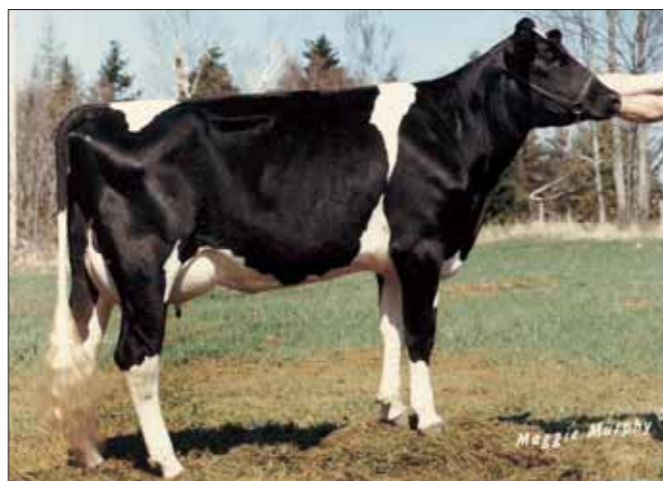
Walkup Bell Lou Etta (v. Bell), 88 punten Productie: 2.01 365 11.099 4,5 3,7