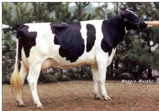
Walkup Astronaut Lou Ann (v. Astronaut), 94 punten Productie: 7.11 365 13.050 3,5 3,2