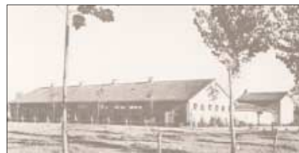
Beneden: 'Bunnik' in 1953, rechts: het complex in 2004