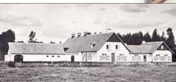
Beneden: het station in 1953, rechts: het huidige complex