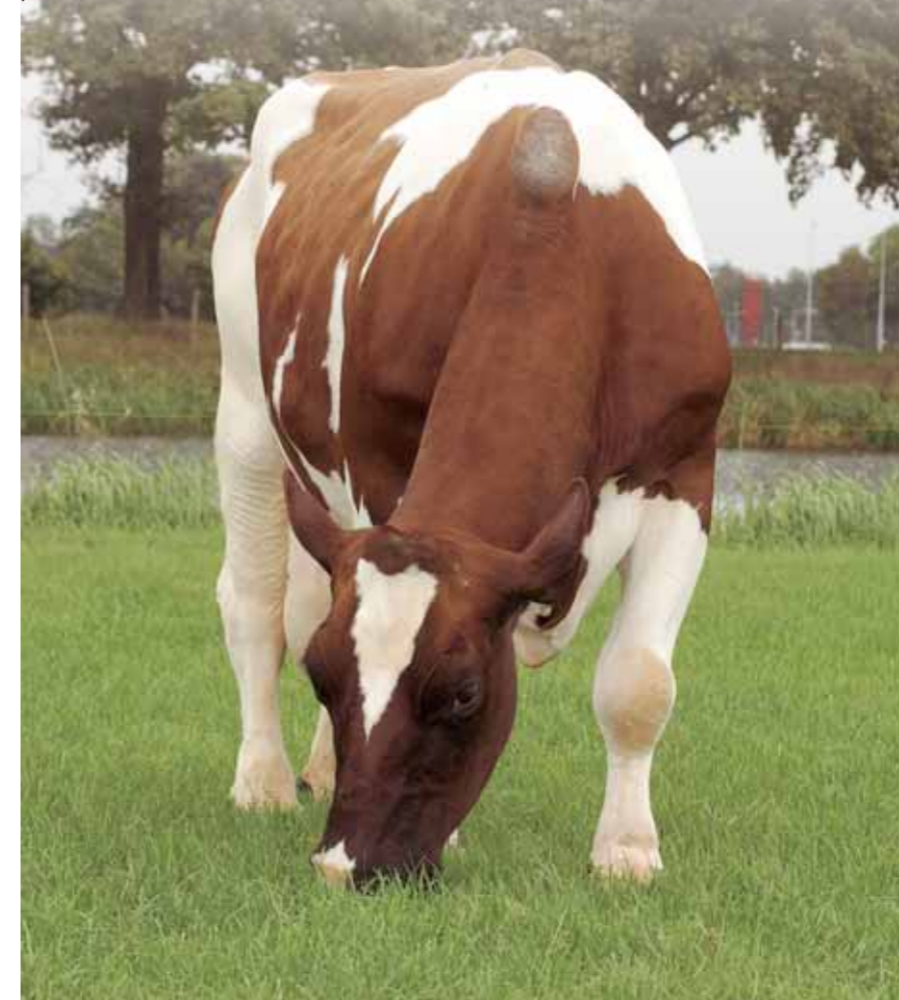
Mies 113 verspreidt via Parom de genen van een koefamilie met langgerekte productieve MRIJ-koeien