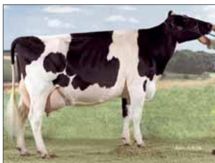
Ijsselvliedt Roza 150 (v. Convincer), reservekampioene middenklasse Prod.: 2.01 462 11.206 4,98 3,56 LW 106