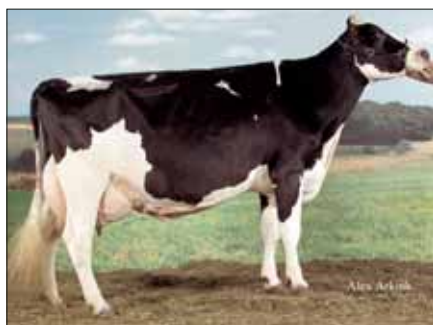
Ijsselvliedt Roza 137 (v. Lucky Leo), reservekampioene senioren Prod.: 2.01 956 27.962 4,30 3,74 LW 137