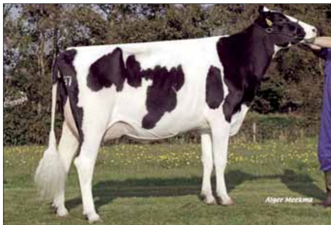
Topcross Jaan 519 (v. CB Allen), kampioene vaarzen Productie: 2.05 16 435 4,57 3,13 LW 99 I.I.