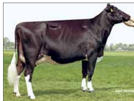
Dikkie 135 (v. Juror), reservekampioene vaarzen Prod.: 2.08 187 7144 3,70 3,42 LW 121