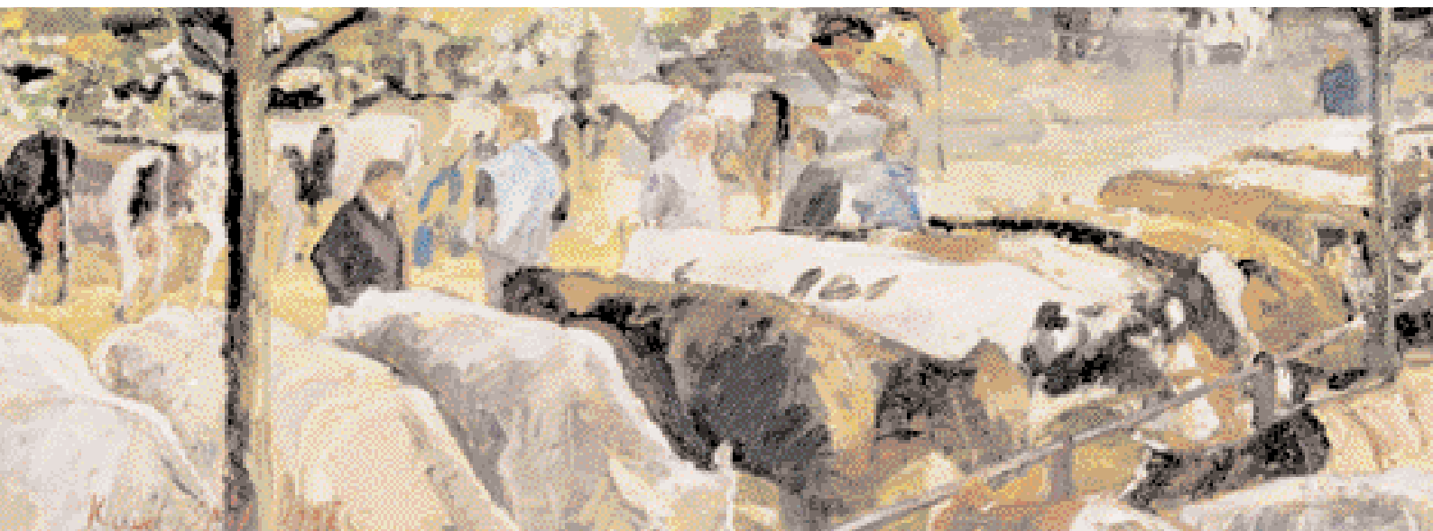
Ruud Spil: Veemarkt Purmerend (1998), 40 x 100 cm

Het beeld blijft dwalen door z'n gedachten. Wanneer Ruud Spil bij z'n atelier in het piepkleine Watergang arriveert, posteert de schilder de motor aan de waterkant. De helm maakt plaats voor de pet en snel maakt hij in het schetsboek een ruwe impressie, of misschien zelfs wel een klein paneel in olieverf, snel even vastgemaakt in het deksel van de schilderskist.