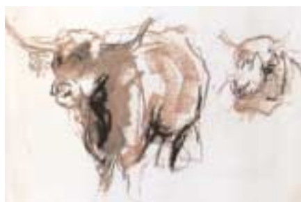
Studies van Hooglanders