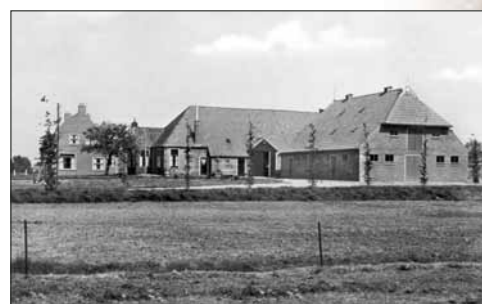
Onder het station in 1956, rechts het complex tegenwoordig