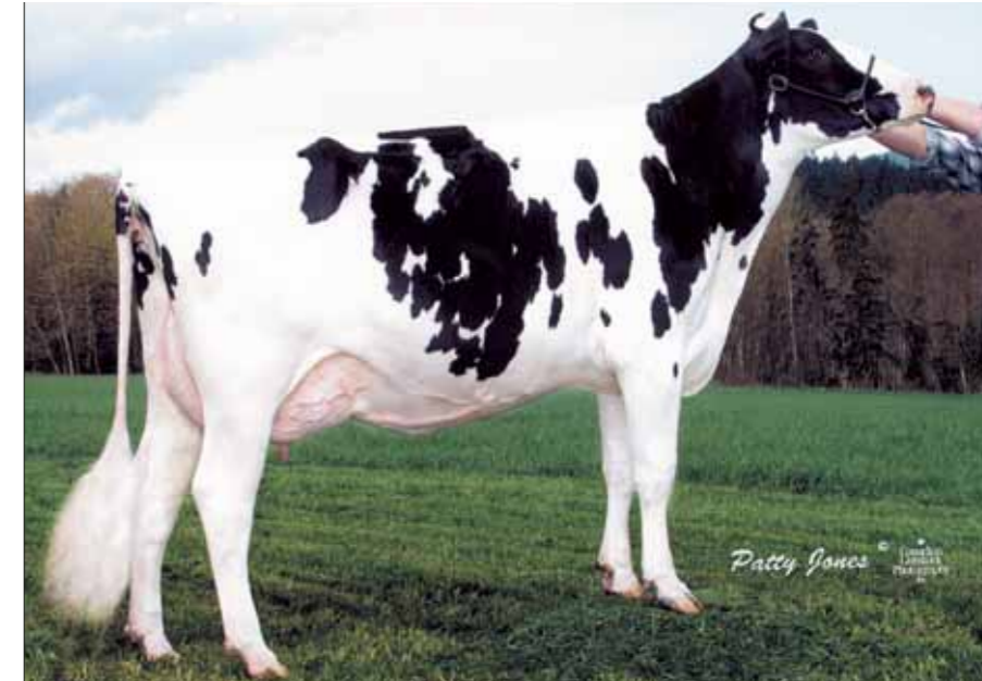
Wedgwood Trixie Gibson (v. Gibson), 89 punten. Eerste lijst: 305 9360 4,2 3,4