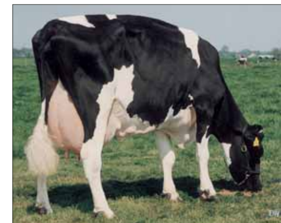
Jabot Albertje, grootmoeder Lucky Mike (84 pnt.) Prod.: 4.01 305 13.074 4,17 3,32 LW 130