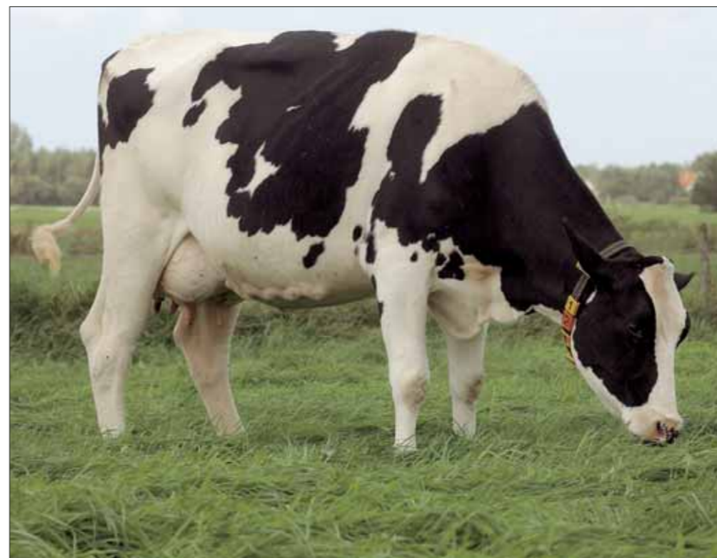
Rus Ron Albertje (v. Russel), nichtje van Lucky Mike (85 punten) Productie: 2.04 305 8508 4,05 3,64 LW 114