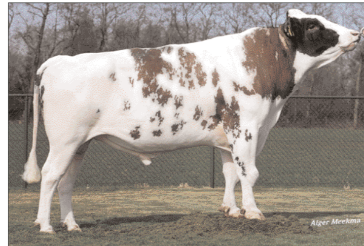
Kian met afstand meest gebruikt bij roodbont

Aan de winnende hand blijft het Belgisch-witblauwras. De winst ten opzichte van het vorige seizoen is fors en bedraagt precies twee procent. Daarmee wordt inmiddels één op de tien inseminaties uitgevoerd met een witblauwstier. De goede prijs voor kruislingkalveren en de wetenschap dat opfok van kalf tot koe duur is haalt veel veehouders over om een steeds groter deel van de veestapel te insemineren met vleesstieren. Het zijn vooral de Belgische blauwen die hiervan profiteren, de overige vleesrassen spelen een ondergeschikte rol bij de gebruikskruising.