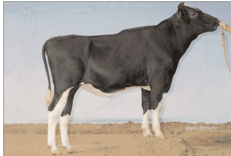
Himster Grandprix prolongeert titel