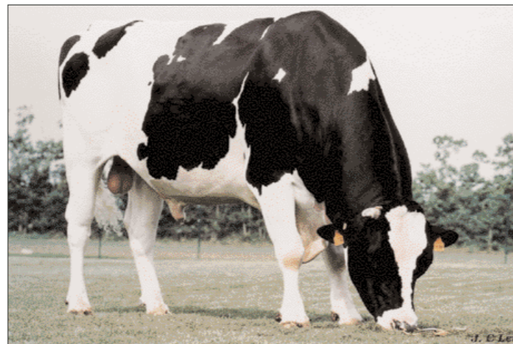
Jocko Besne voor het eerst voorbij Design

van de markt. Onder de overige KI's schaarst NRS een aantal vrije KI-verenigingen die hun totalen niet herkenbaar gepubliceerd willen hebben. Zij zagen hun aandeel bijna verdubbelen, maar in de totale markt is hun rol met 1,1 procent vooralsnog beperkt.