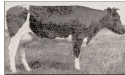
Davidson 8 (boven), ingeschreven in fokregister Blokker-Westwoud (326), in het NHRS (5764) en het NRS (5821 Register)

Davidson 11 vertrok naar Japan, samen met twee stalgenotes en met de stier Frans 64, een zoon van de preferente Frans 41 uit stal Groneman in Wieringerwaard, waarvan ze vlak voor haar vertrek nog een vaarskalfje had gebracht: Davidson 14.