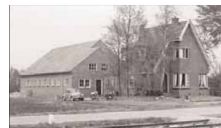
Links: het station in 1954, rechts: het gebouw in 2004