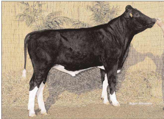
Addisonzoon Rafael afkomstig uit de Holim Heidifamilie

Tot de verliezers van deze draai behoort gehalteverer-