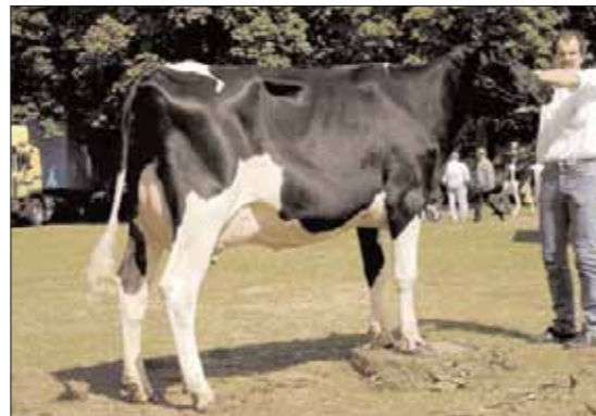
1851 Nele (v. Leadership), kampioene bij de vaarzen Productie: 2.01 109 2861 3,55 3,12