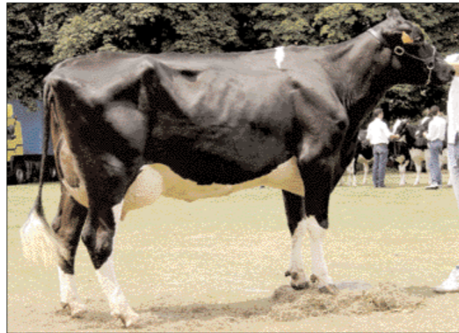
Lena (v. Magnum), kampioene jonge koeien Productie: 2.04 305 8289 4,12 3,38