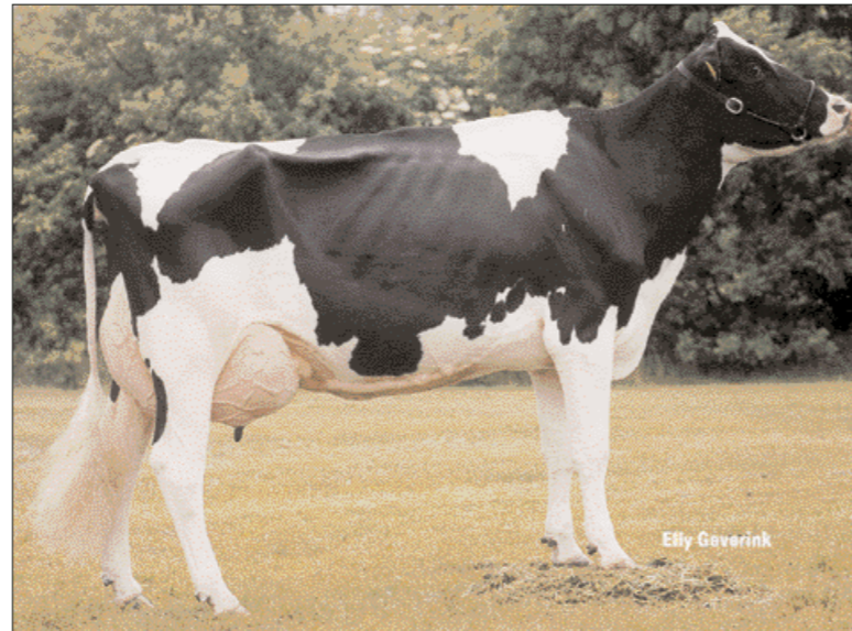
0563 (v. T Funkis), middenkampioene Productie: 2,04 365 10.456 3,80 3,31