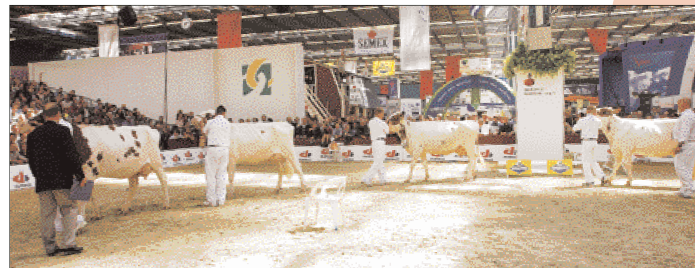
De jeugdige, vrij extreme dochters van Lightning bekoorden vooral in zij aanzicht