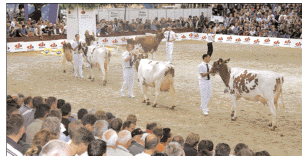
Delegatie van Oudkerker Reno bevestigt in frame en uierkwaliteit

mes. Voorin was bij elk van hen een goede breedte waar te nemen, een lijn die ook naar de achterhand van de koeien was door te trekken. Op stand stoorden de vollere hakken van het grovere beenwerk. Ondanks de combinatie met lagere verzenen scheen dat punt de beweging van de dochters in de ring niet te belemmeren. Bij het vijftal was een uier met prima balans en sterke ophangband te zien die bij elk van hen nog net iets vaster kon zijn aangehecht. Na Misty was het de beurt aan het vijftal van halfbroer Almere Pericles (Tulip x Jabot), een product van Holland Genetics, om de kwaliteiten van hun vader te tonen. De dieren lieten een eerste degelijke indruk na. Dieper ingaan op details toonde onderling lichte variatie in openheid en bovenlijn. Ook de horizontale kruispartij in het frame konden de vijf niet verbloemen. In uiervorm waren de dieren uniform. Stuk voor stuk toonden de melkklieren een stevige ophangband die de achterspennen dicht tegen elkaar trok.