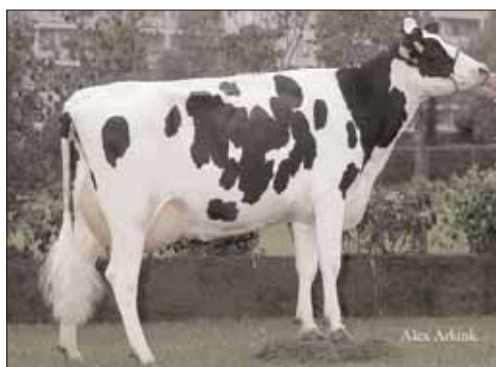
Tjipke 120 (v. Lord Lily), 1a in rubriek 1 Voorspelde prod.: 2.02 305 8284 4,44 3,51