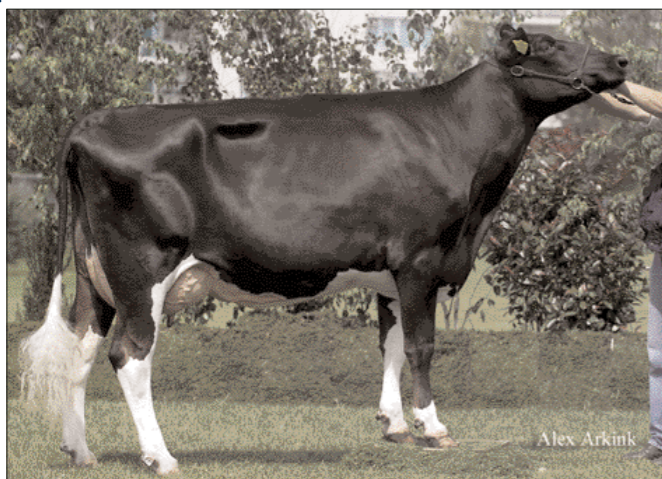
Wiersma 579 (v. Lucky Leo), 1a in rubriek 4 Voorspelde productie: 2.06 305 9417 3,84 3,33