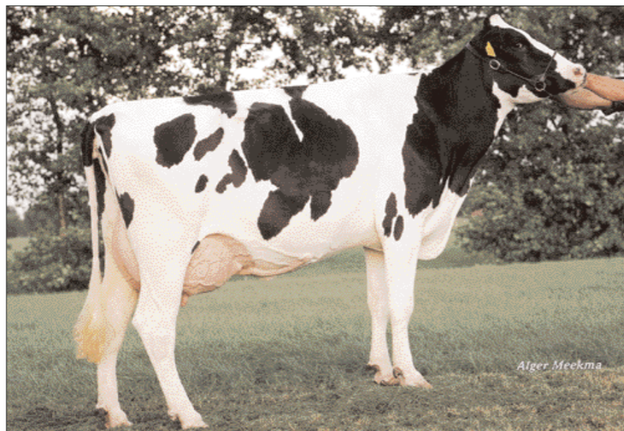
Swamo Jans 2 (v. Jabot), 88 punten en moeder van Swamo Jewel Productie: 2.02 9680 4,30 3,30