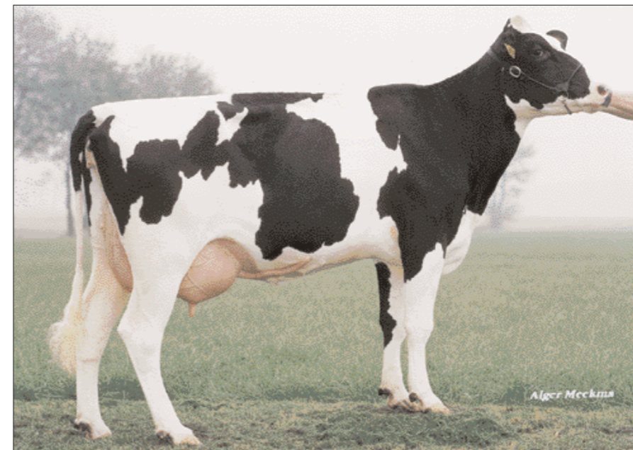
Jans 82 (v. Sunny Boy), 84 punten en moeder van Swamo Jaron Productie: 2.02 305 9615 4,22 3,41

Het succesverhaal voor de jonge bezitters van de Swamokoeien (de naam komt voort uit de combinatie Swank en Moree) ging verder, want de ET-sessie met Jabot leverde drie vaarskalveren op, waaronder