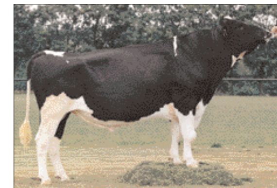
Swamo Jaron (Carousel Amos x Jans 82)

bij. Ze deed het binnen ons bedrijf erg goed, maar toen we bericht kregen dat er voor haar KI-interesse bestond, hadden we haar al drachtig gemaakt van Etazon Fruita', vertelt Pierre Kuijken. 'We melken inmiddels 170 koeien, maar de Fruitadochter Jans 9861 wist in het grote koppel als vaars een productiepiek te halen van meer dan 50 kg melk.'