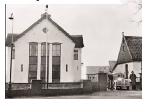
Beneden: het KI-station in 1950, rechts het gebouw in 2004

Nergens hardnekkiger dan in Noord-Holland was in de jaren zeventig het verzet tegen het HF-bloed: men had veel te verliezen. De laatste ster, Kastanje's Frans 101, was al beschikbaar in heel de provincie, toen zich in Sijbekarspel de eerste werkelijke Holsteiner meldde: Metcalfs Elevation Dan. Hij kreeg in Frankrijk, Duitsland en in Nederland vereringscijfers en die mochten er zijn. Een van zijn dochters leverde de overgrootmoeder