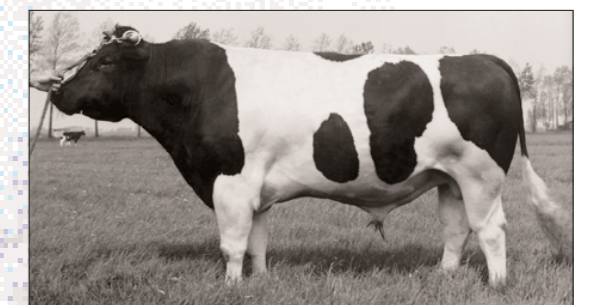
Boven: Pan 59, onder: Metcalfs Elevation Dan