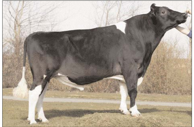
Lucky Mike haalt met 117 (4,25) hoog exterieurniveau