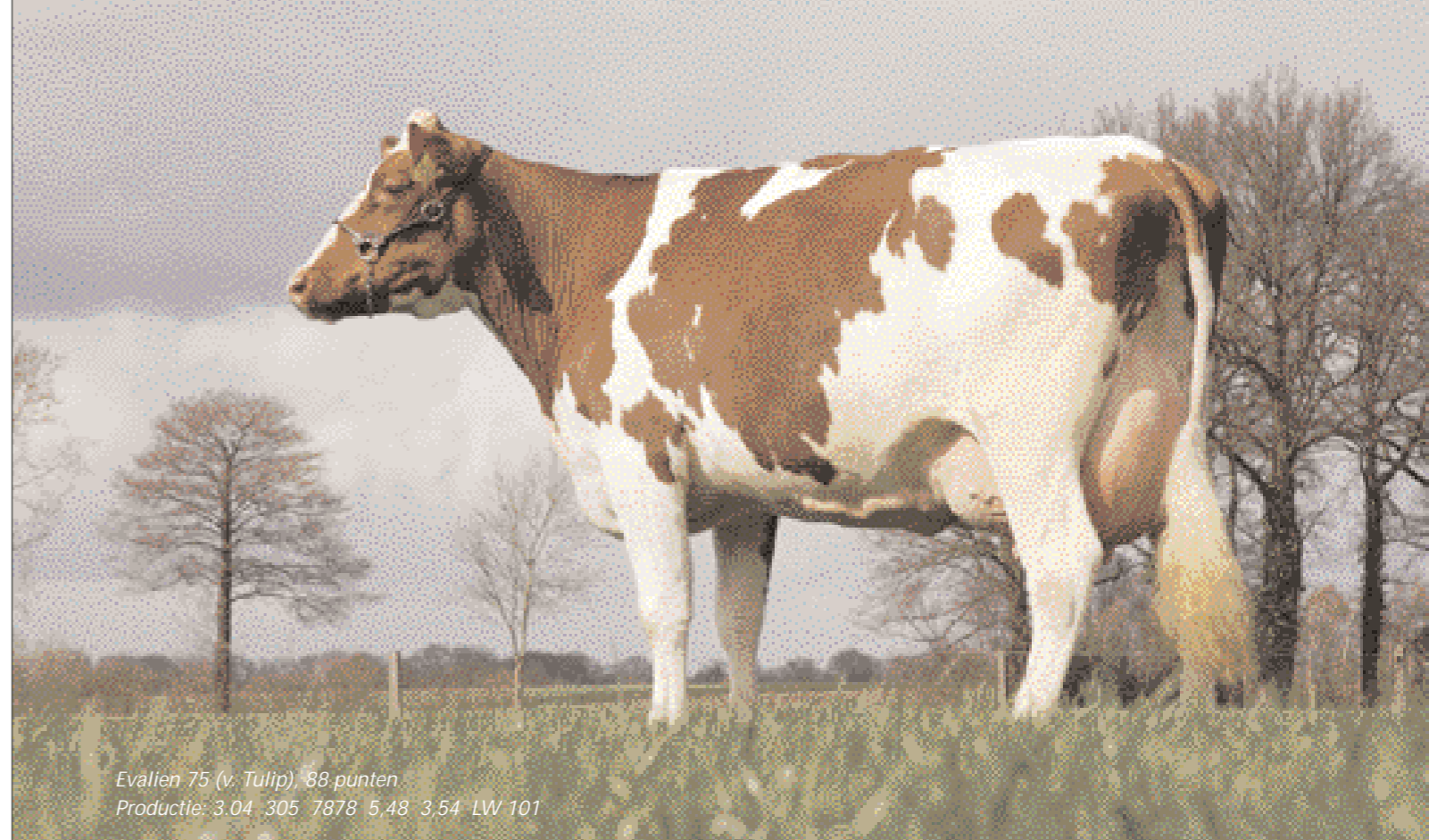
Evallen 75 (v. Tulip), 88 punten Productie: 3.04 305 7878 5.48 3.54 LW 101

lend jaargemiddelde toont, bij een productie van 8531 kg melk met 4,60 % vet en 3,49 % eiwit, een gemiddelde leeftijd van 5.03. Bij de laatste bedrijfsinspectie werd voor 19 vaarsen een gemiddelde van 83,9 genoteerd. Zowel de tweedekalfs- als de oudere koeien zijn met gemiddeld 84,8 punten ingeschreven. De veestapel bestaat uit 110 roodbonte melkkoeien. In combinatie met 140 stuks jongvee en 60 hectare cultuurgrond vormen zij de basis van het melkveebedrijf van de broers. De verwachting dat goed overleg bij deze bedrijfsopzet erg belang-