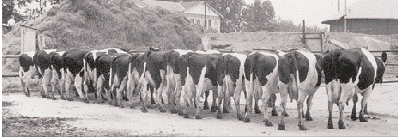
De 15 koeien van Dekker bij hun aankomst op de Waiboerhoeve in Millingen aan de Rijn

lijk om voetstoots aan te nemen dat de veestapel over superieure productie- en gebruikseigenschappen zou beschikken'.