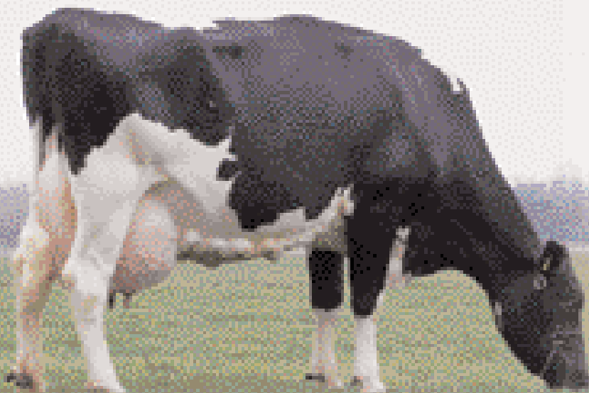
Koosje 28 (v. Labelle), 84 punten Prod.: 5.09 302 15.636 3,71 3,47 LW 122