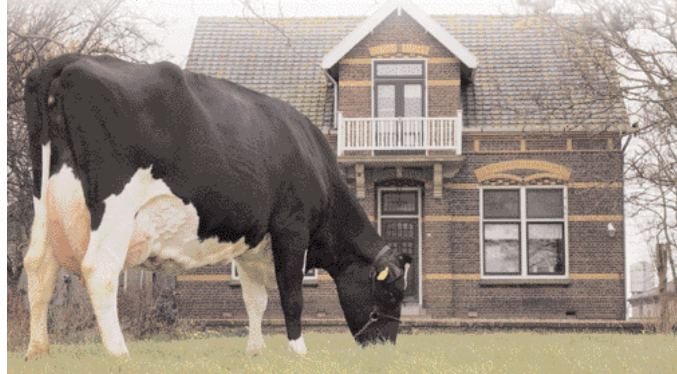
Sarina 74 (v. Eros 68), 83 punten. Productie: 5.04 343 13.415 5,30 3,75 LW 118