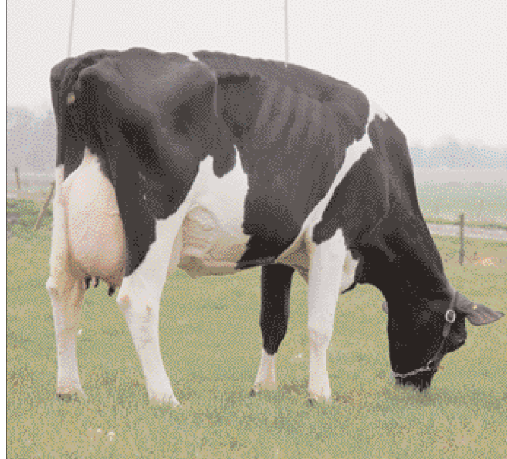
Naomi Ce (v. Celsius), 85 punten Productie: 3.06 305 11.819 3,81 3,41