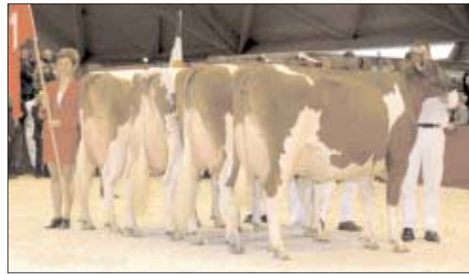
Zwitserse roodbontploeg zegeviert