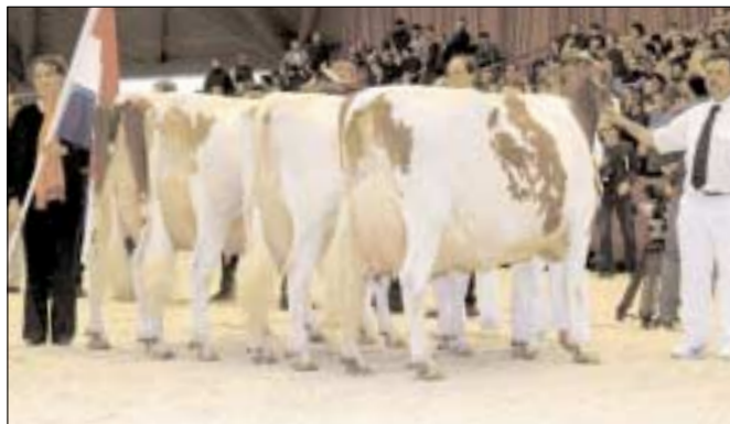
Nederland op tweede plek

koeien minimaal 7500 liter, maar dat was eigenlijk meer uit commercieel oogpunt. Na het selecteren was het nog het moeilijkste om de veehouders te overtuigen hun koeien af te staan. In totaal zijn de koeien zes weken van het bedrijf. Een week voor het EK hebben we alle koeien samengebracht om de definitieve beslissing te nemen. Daarna staan ze een aantal dagen in Brussel en wanneer ze terugkomen houden we alle dieren vier weken in quarantaine op een apart bedrijf. Maar met deze resultaten is dat zeker de moeite waard.'