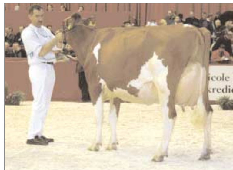
Zwitserse Sunnibel Vision Ladie wint juniorentitel

vanwege de hogere achteruier verwees ze Calanka met haar mooie frame naar de reservepost.