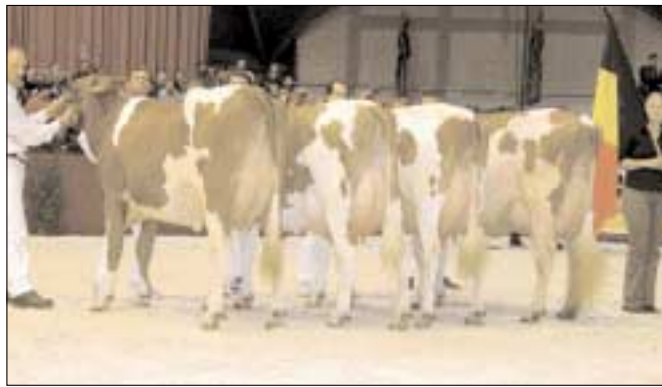
Belgische equipe pakt brons