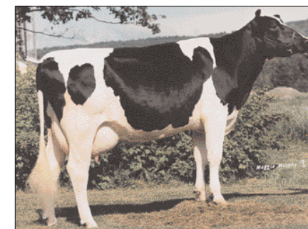
Productiviteit voert terug op Amber

op 3 december 1996 stuurde. 'Eerst dachten we aan de Pietjes, want die familie beviel ons erg.' Hun vooropgestelde bedrag bleek uiteindelijk veel te laag te liggen om één van de Pietjeskalveren in huis te halen. 'Omdat dat niet gelukt was, kocht onze koopman twee andere kalveren voor dat bedrag. We hadden er dus twee voor de prijs van één.'