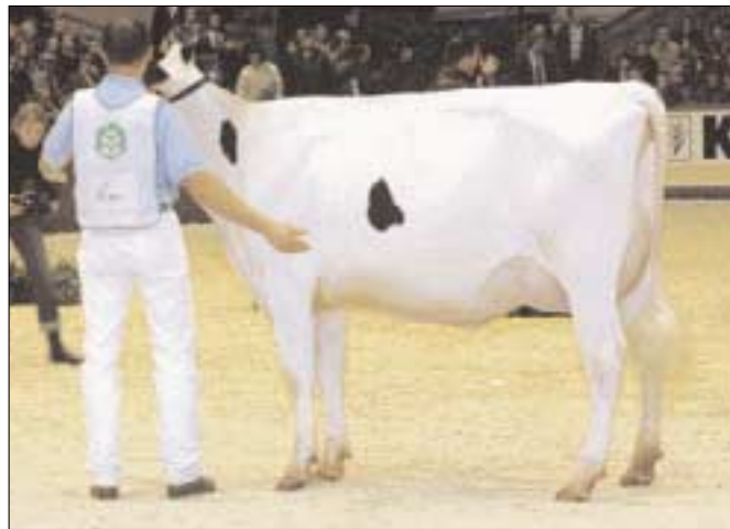
Italiaanse Pascia pakt overwinning bij de vaarzen

De melktypische Al-Pe Dorian (v. Al-Pe Bell Rex Quartz) won dankzij haar sterke ophangband de volgende rubriek. Dorian , van de Italiaanse Beltraminobroers uit Buriasco, was een koe van het vrouwelijke, slanke type zoals jurylid Davies ze graag zag. Fijn en plat in het bot, met superdroog beenwerk en een mooie flank en ranke hals. Ze kreeg in de finale het reservelint omgehangen om-