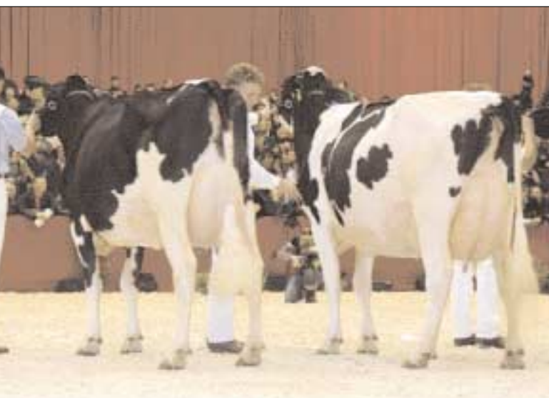
Lady (r.) en Doriana (l.) winnen in middenklasse

ver weg staat van wat er op grote internationale keuringen voorop in de ring loopt.'