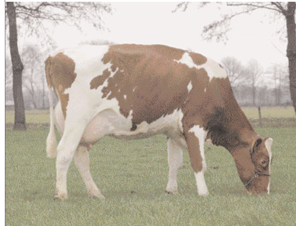
Cunera 54 (v. Lima), nog niet ingeschreven Voorspelde productie: 2,01 9474 4,15 3,56 LW 131